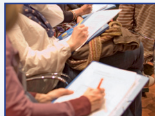
IDEAS PARA LLEVAR.