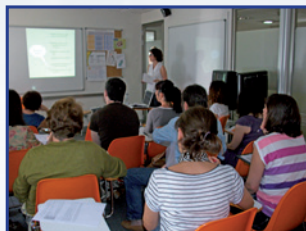
EXPERIENCIAS POR COMPARTIR,